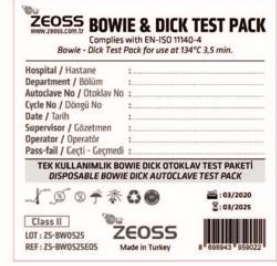
Bowie Dick Test Packs